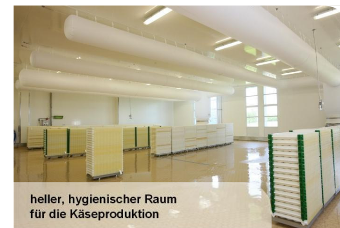
heller, hygienischer Raum für die Käseproduktion