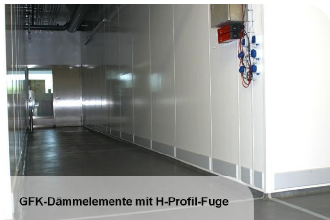
GFK-Dämmelemente mit H-Profil-Fuge

Bei der Produktion, Verarbeitung, Lagerung und Distribution von Lebensmitteln sind die Hygieneanforderungen extrem hoch. Die tägliche Reinigung mit Wasser und aggressiven Reinigungsmitteln sowie das dauerhaft feuchte Milieu in diesen Räumlichkeiten verlangen spezielle Lösungen, insbesondere für Wände und Decken.