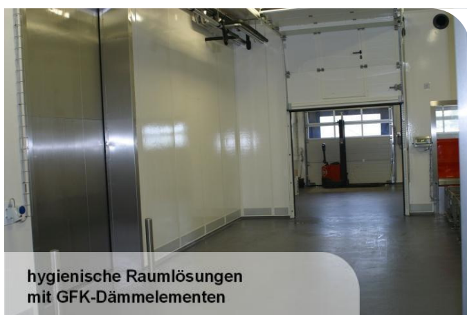
hygienische Raumlösungen mit GFK-Dämmelementen