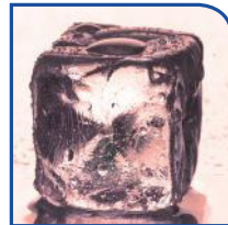
EasyTape 4 GFK-Direktmontage