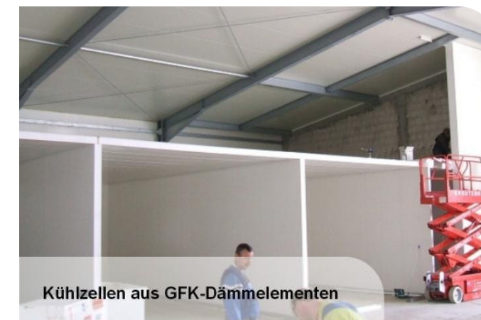
Kühlzellen aus GFK-Dämmelementen