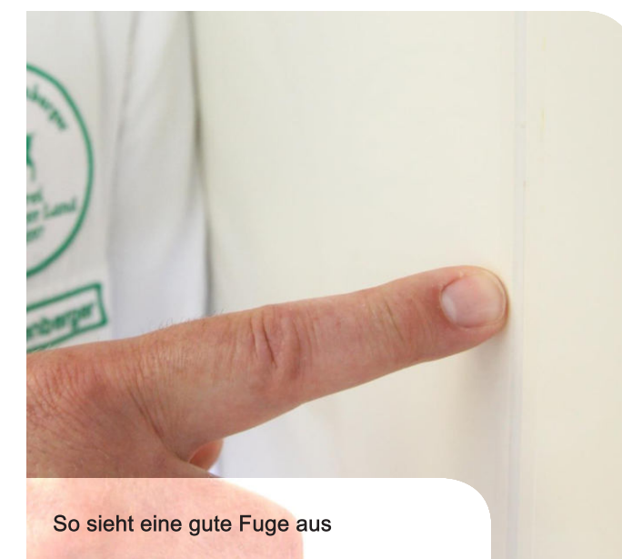
So sieht eine gute Fuge aus