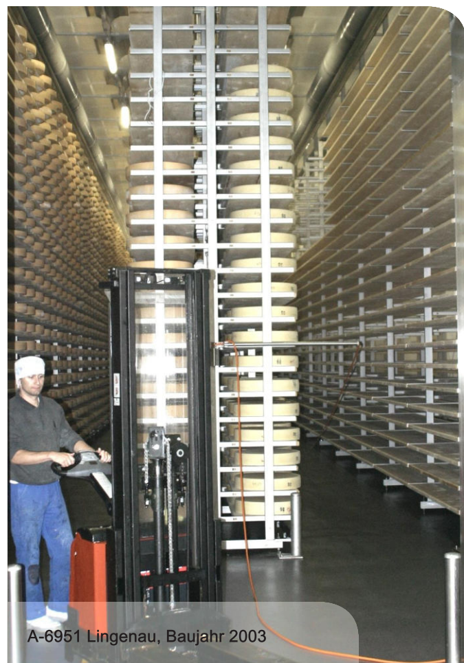
A-6951 Lingenau, Baujahr 2003